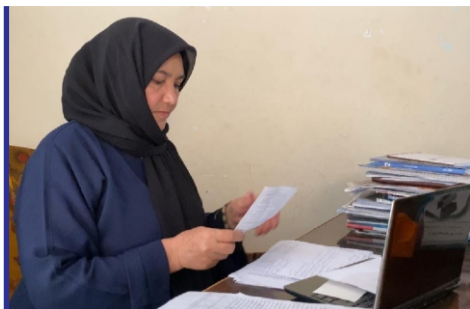
گفتگو با نفس گل جامی...