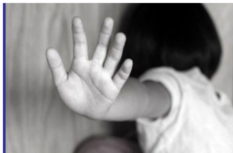
تجاوز جنسی بر یک دختر...