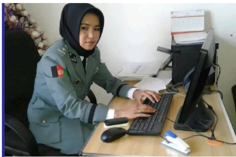
طالبان در دایکندی...