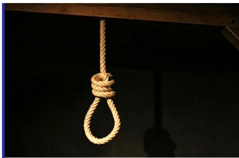
خودکشی یک دختر جوان ...