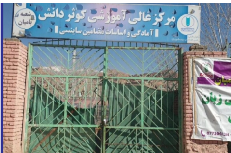
اخراج دختران در پی ...