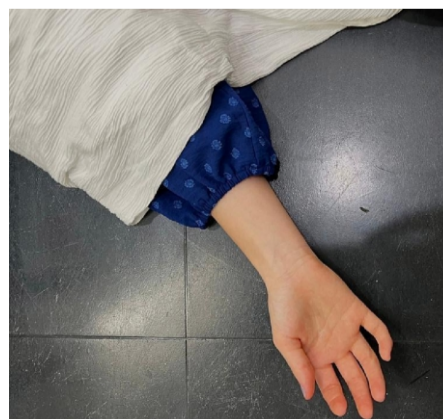
شلیک تفنگچه و حلق آویز با ریسمان، دست به خودکشی زده و جان باخته اند.

خبرگزاری زنان افغان: منابع محلی در ولایت غور می گویند که یک دختر ۱۶ ساله درین ولایت با شلیک تفنگچه خودکشی کرده است.