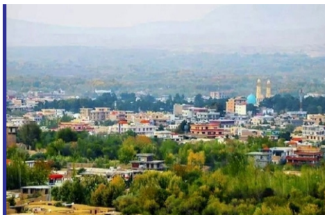
گشت و گذار بانوان به...