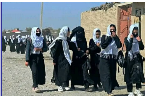
دختران دانش آموز در...