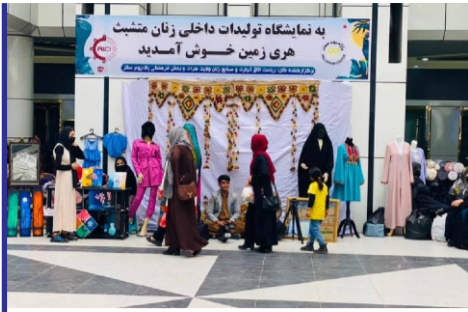
افتتاحیه چهارمین مارکت...