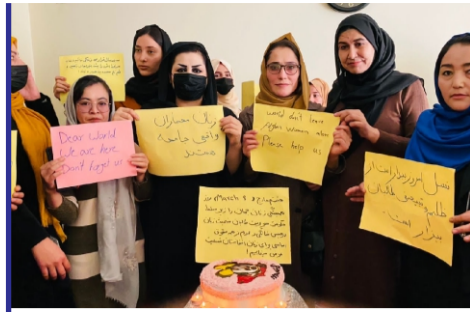
مکتب انتقادی کابل...