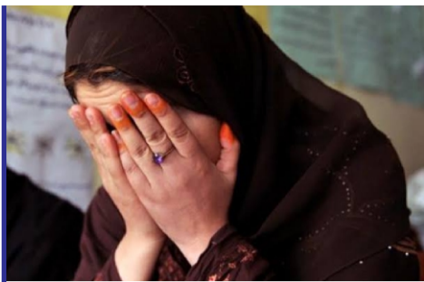
یک عضو طالبان در...