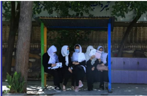
یونسکو: محرومیت بیش از...