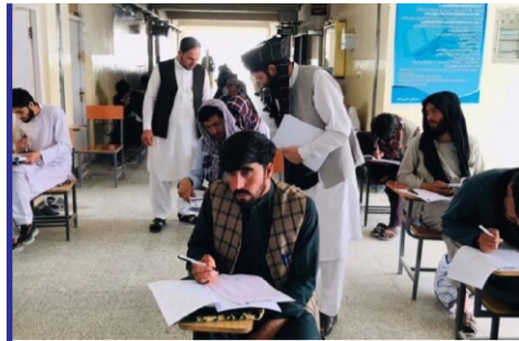
برگزاری امتحان کانکور...