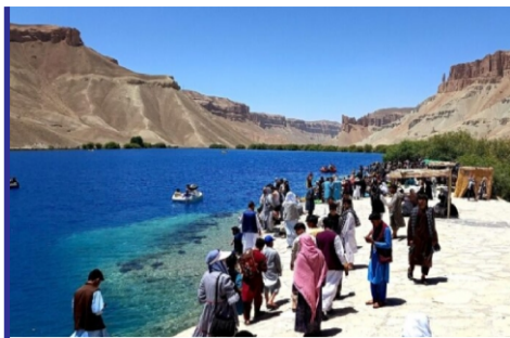
در پی وضع محدودیت بر...