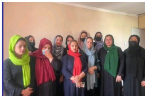
هشدار اعضای جنبش...