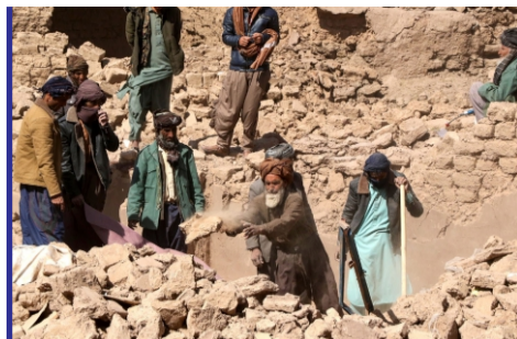
زلزله هرات؛ زنده جان...