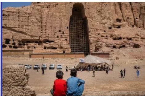
میراث های فرهنگی جهانی... «ص ۳»