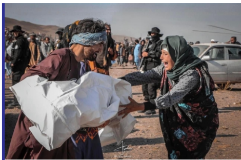
وضعیت بد قربانیان و نبود... «ص ۲»