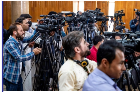
خبرنگاران در افغانستان...