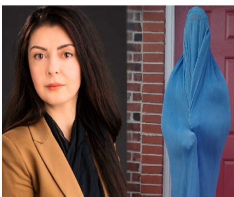
خانم حیدری در مورد واکنش مردم به این پوشش چادری یا برقع نوشته است که حین قدم زدن در