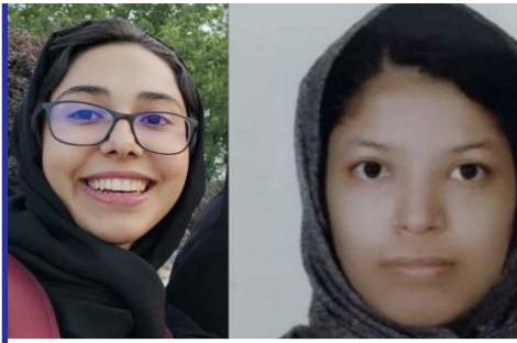
یک دانشجوی اهل افغانستان..