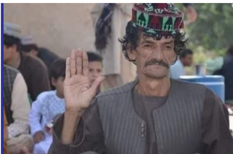
سازمان تحقیقات حقوق بشر...