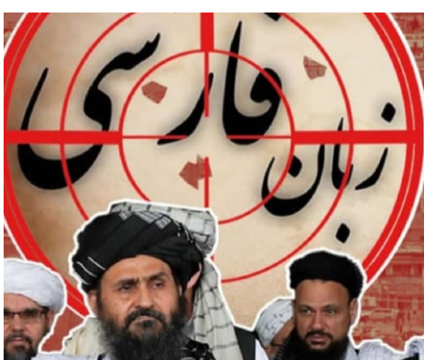
نگاره مولانا جلال الدین محمد بلخی در شهر مزار شریف را تخریب کرده اند.