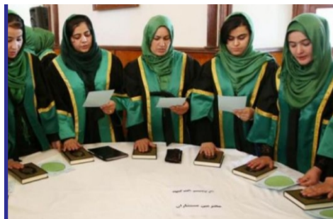
اوضاع نابسامان قاضی های...