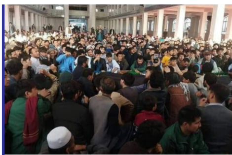
واکنش ها و نگرانی ها از...