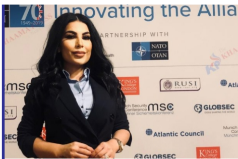
آریانا سعید هنرمند مشهور...