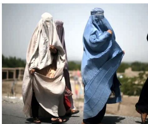
گفته می شود وضعیت زنان و دختران در قندهار، به طور کلی بسیار وخیم گزارش می شود. ادامه ص ۳

قندهار یکی از ولایت های مهم در افغانستان است. رهبر طالبان از این ولایت فرمان ها و محدودیت ها را بر علیه زنان صادر می کند. زنان و دختران در این ولایت بیشتر زیر ذره بین طالبان قرار دارد. طالبان علاوه بر منع کار و تحصیل، گشت و گذار را نیز بر روی زنان بند کرده است. محدودیت های بر زنان در قندهار شامل مواردی چون، عدم دسترسی به آموزش و تحصیل، ازدواج های زودرس، خشونت خانگی، محدودیت های شغلی و عدم حضور کامل در فعالیت های اجتماعی و اقتصادی است.