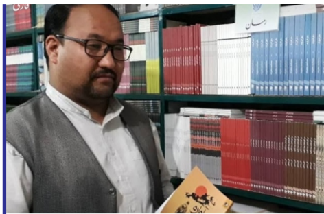
سانسور کتاب و شکنجه...