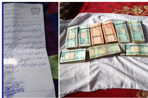
طالبان برای رهایی زنان...