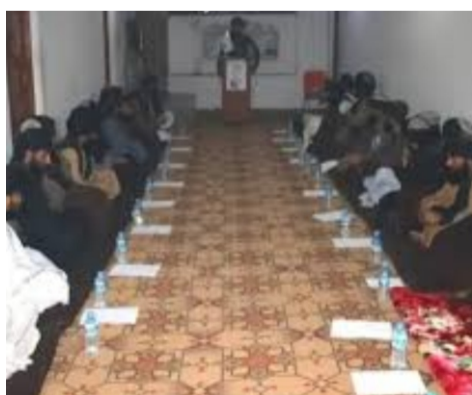
خدمت گذاری در رسانه های اجتماعی، اصول و رعایت نمودن نویسنده گی و دست آوردها به بحث و گفتگو